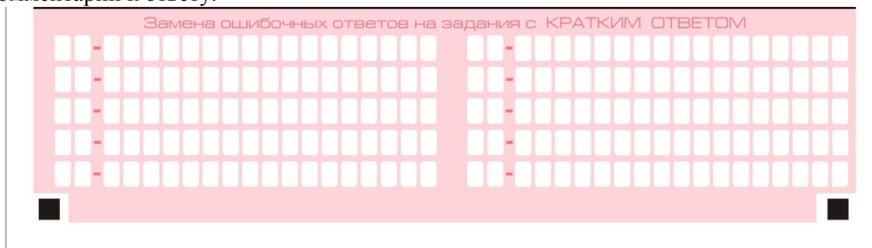
Рис. 8. Область замены ошибочных ответов на задания с кратким ответом

Запрещается записывать ответ в виде математического выражения или формулы. В ответе не указываются названия единиц измерения (градусы, проценты, метры, тонны и т.д.) – так как они не будут учитываться при оценивании. Недопустимы заголовки или комментарии к ответу.